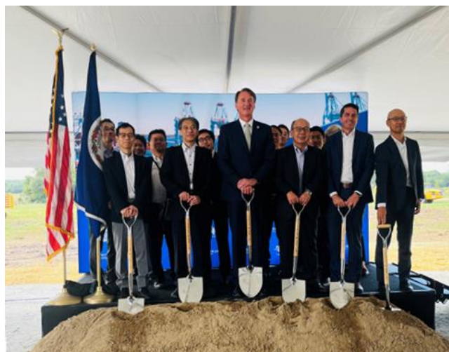
▲9月4日に開催された起工式の様子