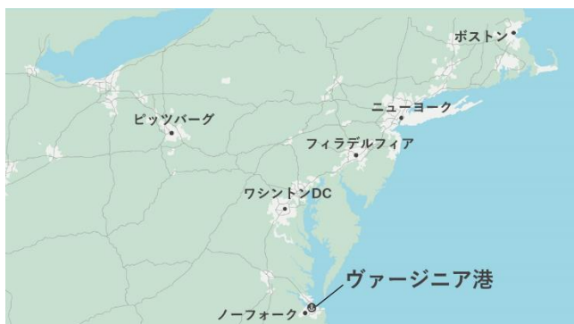
▲東海岸中部をカバーする立地