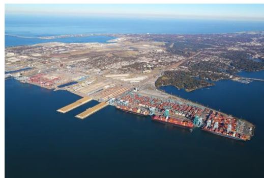
▲ヴァージニア港（イメージ）

米国・東海岸中部の物流を担うヴァージニア港は、旺盛な港湾需要に対応すべく大規模なインフラ拡張工事が進行中で、工事完了後は米国東海岸で最も深い水深（16.5m）を有する港となります。付近の物流施設は空室率が低位で推移しており、今後も物流需要の拡大と賃料上昇が見込まれています。