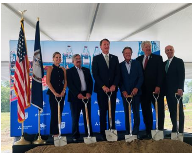
▲9月4日に開催された起工式の様子