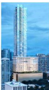
1072 West Peachtree