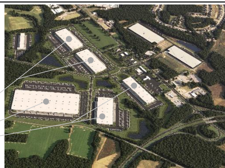
▲完成予想パース (イメージ)

所在地：2925 Pruden Blvd, Suffolk, VA 用途：物流施設、商業施設 敷地面積：983,000 m 2 (全5棟) 総延床面積：約 224,000 m 2 (約 68,000 坪) 総事業費：約500億円 事業シェア：非開示 着工：2024年9月～2026年(予定) 竣工：2025年～2027年(予定) 施工：Clancy & Theys Construction Co.