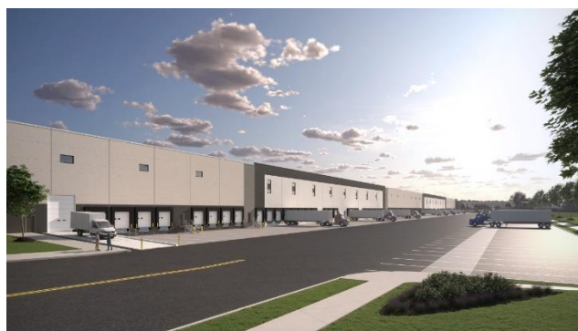
▲貨物車用の駐車スペースを多く設置 (イメージ)