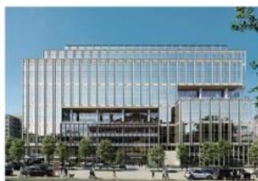
600 Fifth Street NW