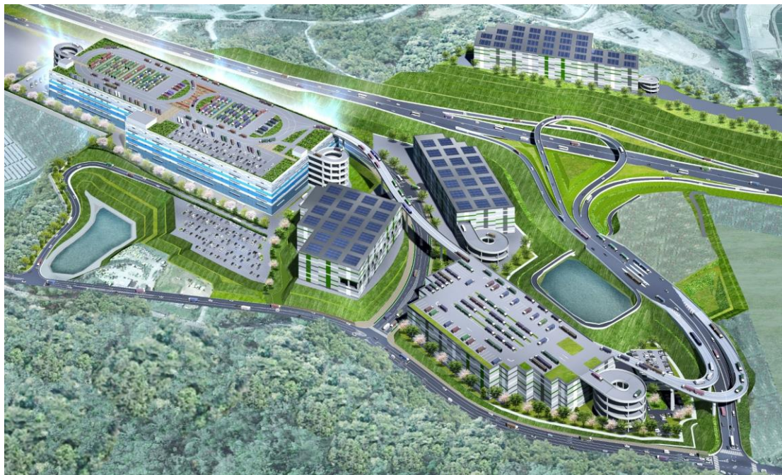
▲京都府城陽市東部丘陵地青谷先行整備地区 高速道路 IC 直結型次世代基幹物流施設（完成予想イメージ）

当社は、関東圏においても本計画同様の次世代のモビリティに対応した基幹物流施設の開発計画について検討を進めています。関東圏と関西圏の両方で基幹物流施設の整備を進め、三大都市圏を結ぶ物流ネットワークの自動化・省人化対応を推進してまいります。