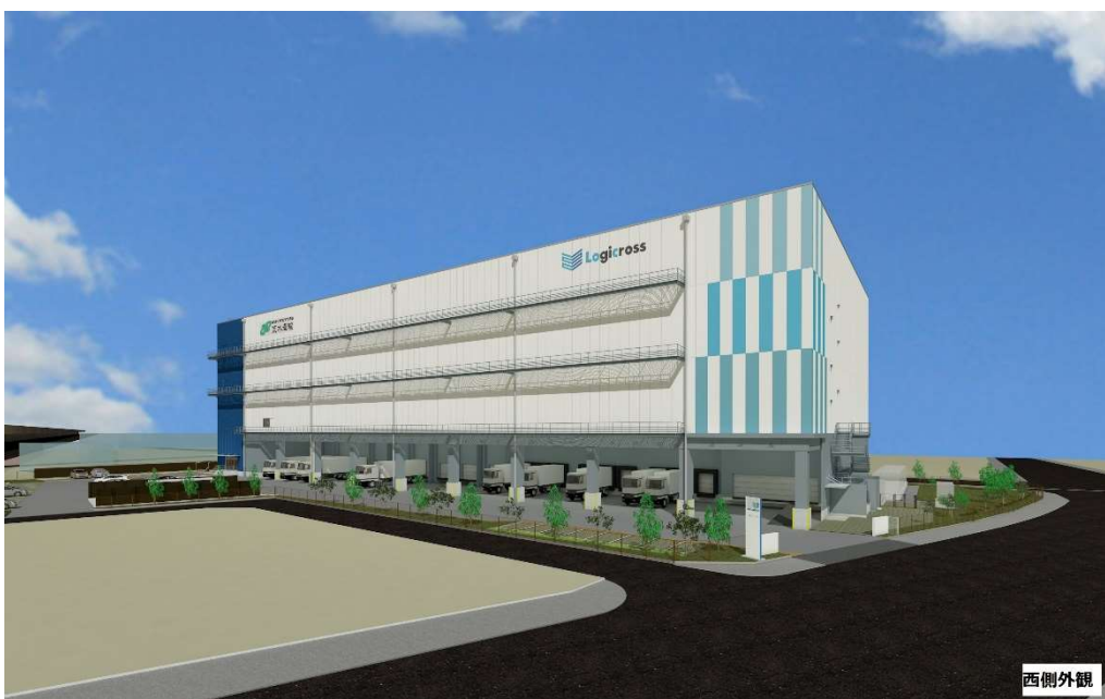
▲ロジクロス大阪交野 外観パース

当社は、物流事業へのニーズの多様化に対応し、開発事業を進めています。昨今のライフスタイルの変化やコロナ禍での巣ごもり需要の高まり、既存施設の老朽化などから、冷凍・冷蔵倉庫の需要は今後とも拡大が期待されていますが、あらゆるテナントニーズに対応すべく、冷凍・冷蔵倉庫の展開にも積極的に取り組んでまいります。